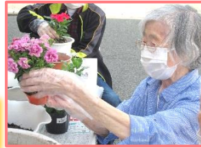
天気がいいと ちょっと「みはらしの丘」へ