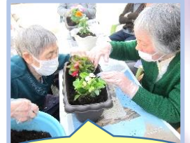
どれどれここにも土が 欲しいわね